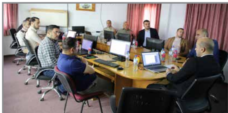
التشريعي ينظم دورة حول منظومة الوثائق البرلمانية