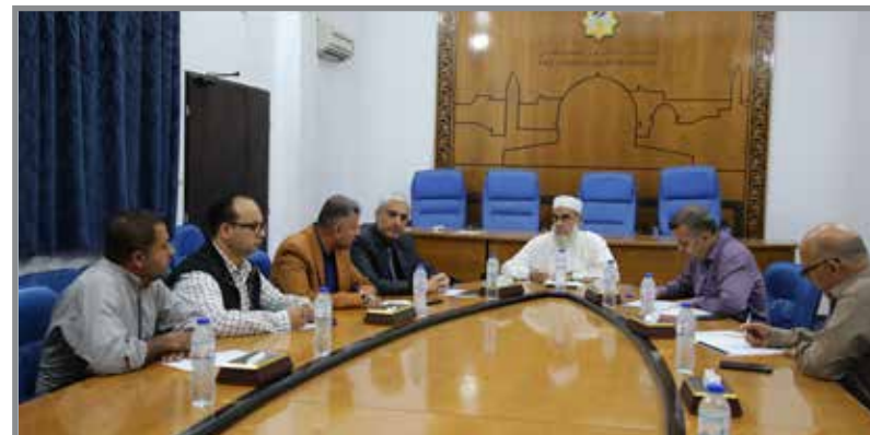
لجنة الرقابة تلتقي باللجنة الدولية لحماية المحتوى الفلسطيني