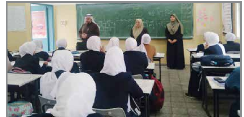
النائب د. يوسف الشرافي خلال جولة على مدارس في شمال القطاع