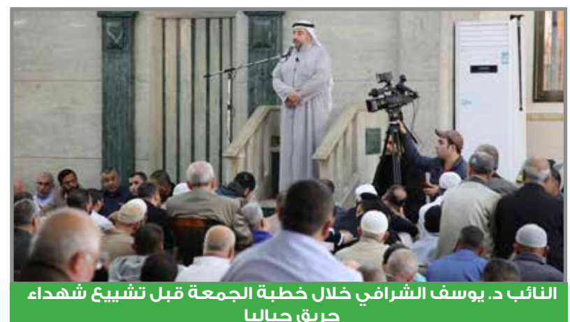
النائب د. يوسف الشرافي خلال خطبة الجمعة قبل تشييع شهداء حريق جباليا