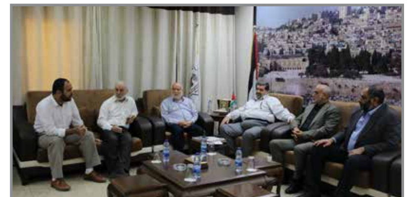
رئاسة التشريعي تستقبل وفداً من رؤساء البلديات السابقين