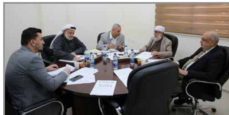
لجنة التربية تناقش تقارير ديوان الرقابة حول أعمال بعض الوزارات ولجان الزكاة