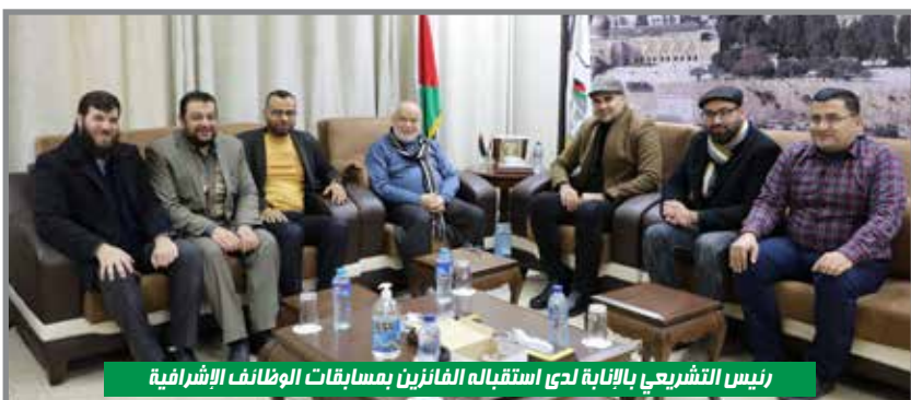
رئيس التشريعي بالإنابة لدى استقباله الشانين بمسابقات الوظائف الإشراقية