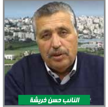
النائب حسن خريشة

من الأماكن. ودعا المؤسسة الفلسطينية الرسمية لأن يكون لها "مواقف جديّة، وليس شكلي في مختلف المواقع والمناطق التي يُنفذ فيها الاحتلال اعتداءاته.