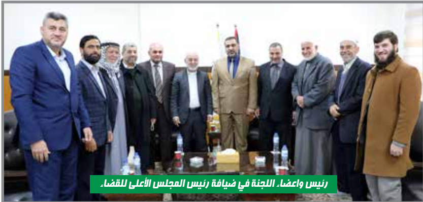
رئيس وأعضاء اللجنة في ضيافة رئيس المجلس الأعلى للقضاء.

وأكد على ضرورة استمرار التواصل والتنسيق بين أركان منظومة العدالة كافة سواء وزارة العدل أو النيابة العامة والقضاء، وذلك للوصول للعدالة واحقاق الحقوق،