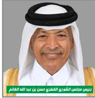
رئيس مجلس الشورى القطري حسن بن عبد الله الغانم

مواجهة الإجرام والعنجهية الصهيونية بحق الأسيرات الفلسطينيات اللواتي تُهدد حياتهن وتُسلب حريتهن وتُمتعن كرامتهن الإنسانية. جاء ذلك خلال رسالة وجهها لكلاً من: البرلمان العربي، ومنظمة التعاون الإسلامي، ورابطة برلمانيون لأجل القدس، والاتحاد البرلماني العربي، والبرلمان الأوروبي، الاتحاد البرلماني الدولي، والبرلمان الأفريقي. وطلبهم في رسالته باتخاذ الإجراءات اللازمة لردع الاحتلال وفضح جرائمه وممارساته العدوانية بحق الأسيرات في مختلف المحافل الإقليمية والدولية، والعمل على تفعيل الآليات القانونية وفي مقدمتها المحكمة الجنائية الدولية لمحاسبة ومعاقبة قادة الاحتلال على الانتهاكات الجسيمة التي ترتكب بحق الأسرى الفلسطينيين بشكل عام والأسيرات بشكل خاص.