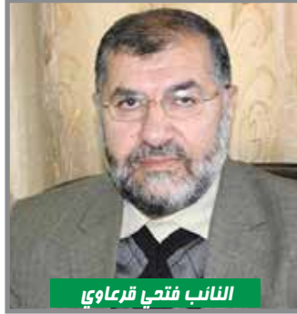
النائب فتحى قرعاوي