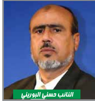
النائب حسني البوريني