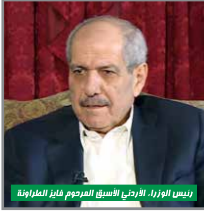
رئيس الوزراء الأردني الأسبق المرحوم فايز الطراونة