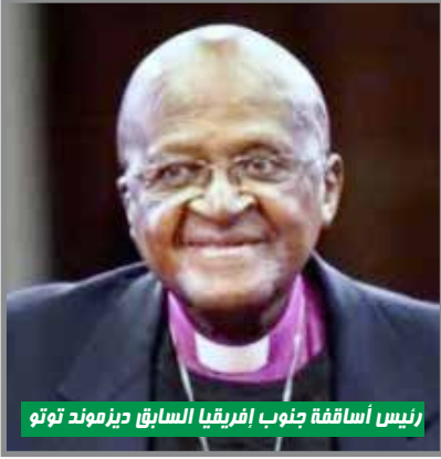
رئيس أساقفة جنوب إفريقيا السابق ديزموند توتو