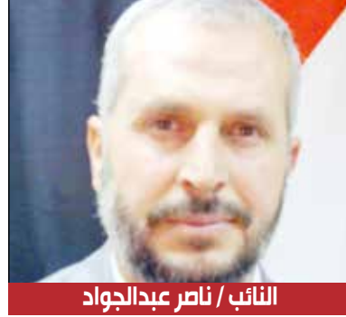
النائب / ناصر عبدالجواد