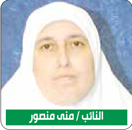
النائب / منى منصور